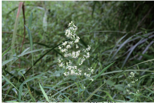
アキカラマツ (秋唐松)