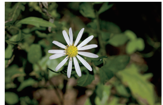
ユウガギク (柚香菊)