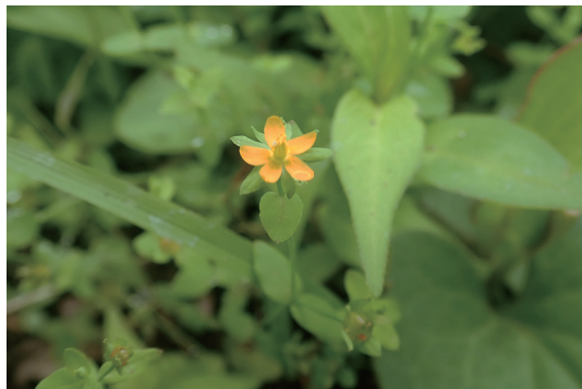
コケオトギリ (苔弟切)