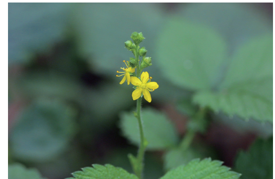
ヒメキンミズヒキ (姫金水引)