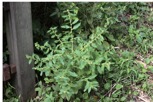
ヤブタバコ (藪煙草)