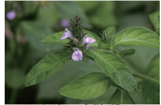
キツネノマゴ (狐の孫)