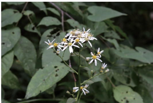
シラヤマギク (白山菊)