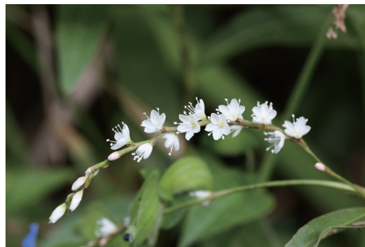
シロバナサクラタデ (白花桜蓼)