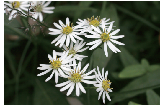
シロヨメナ (白嫁菜)