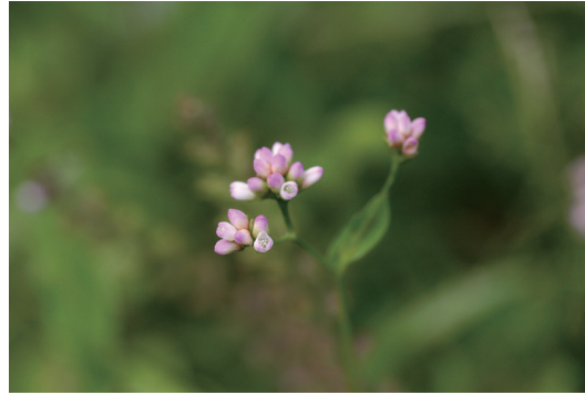
アキノウナギツカミ (秋の鯉摺み)