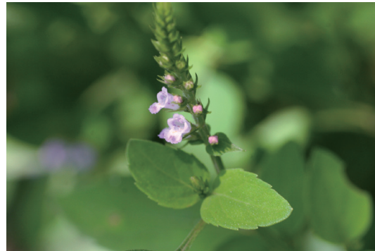
イヌコウジュ (犬香薷)