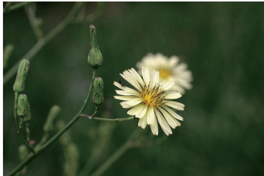
アキノノゲシ (秋の野罌粟)