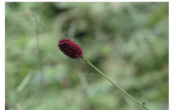
ワレモコウ (吾木香 / 吾亦紅)