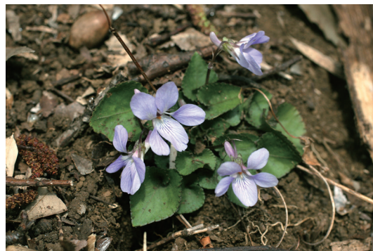
タチツボスミレ (立坪堇)