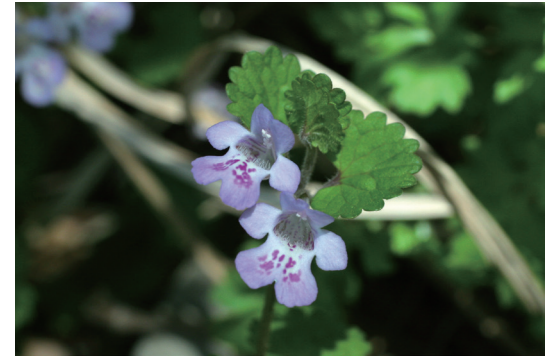
カキドオシ (垣通し)