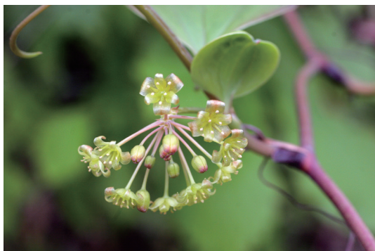
サルトリイバラ (猿取茨)