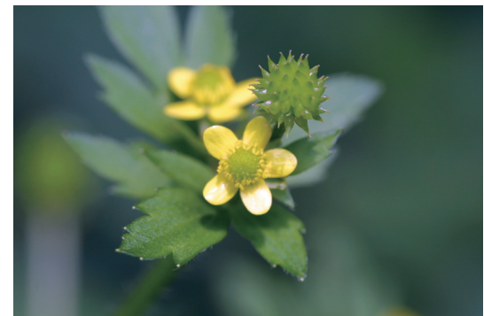
ケキツネノボタン (毛狐の牡丹)