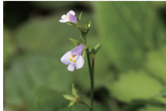
トキワハゼ (常磐爆)