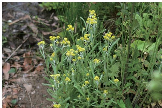
ハハコグサ (母子草)