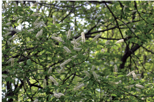
ウワミズザクラ (上溝桜)