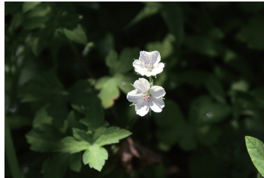
ゲンノショウコ (現の証拠)