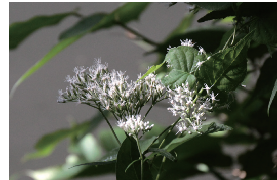
オオヒヨドリバナ (大鶉花)