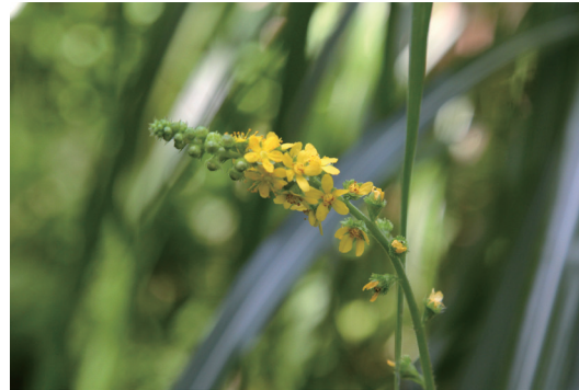
キンミズヒキ (金水引)