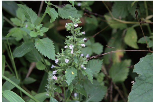
イヌトウバナ (犬塔花)