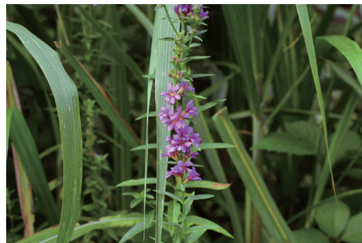
ミソハギ (禊萩 / 溝萩)