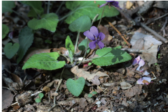
アカネスミレ (茜堇)