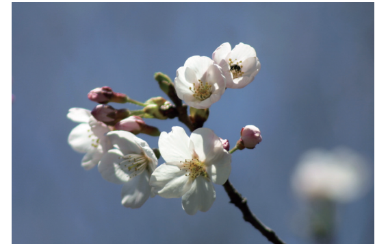
ソメイヨシノ (染井吉野)