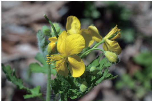
クサノオウ (草の黄 / 草の王)