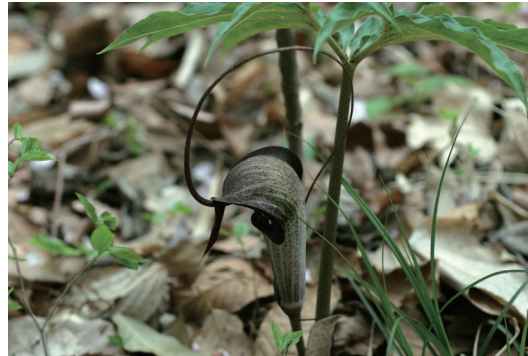
ウラシマソウ (浦島草)