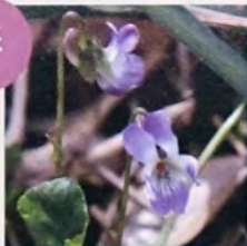
アイオイスマイレ